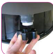
Drain avec son bouchon servant d'outil de démontage Drain with its plug which serves as dismantling tool. Drenaje que sirve para vaciar. El agua del filtro y facilitar así la operación de invernación