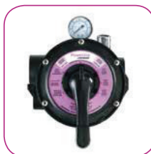
Vanne 6 positions 6 position valve Válvula 6 posiciones