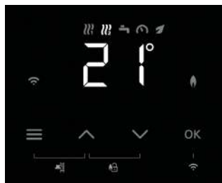
Display LCD cu afișaj pe 7 segmente și butoane tactile

Cazanele murale în condensatie pe gaz Vitodens cu noua platformă electronică au o interfață WLAN integrată. Dacă se dorește, prin aceasta interfață sistemul de încălzire este conectat direct la Internet. Cu aplicația ViCare, operarea încălzirii este foarte ușoară și intuitivă. Acesta stabilește cursul serviciilor digitale și este în contact direct cu specialistul local de încălzire. Aplicația ViCare oferă informații despre starea de operare curentă a sistemului de încălzire, programe de timp pentru încălzire și prepararea apei calde și ajută la reducerea costurilor cu energia. Este compatibil cu aproape toate dispozitivele iOS și Android.