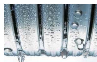
Schimbătorul de căldură Inox-Radial

Schimbătorul de căldură Inox-Radial rezistent la coroziune din oțel inoxidabil este „inima” cazanului Vitodens 100-W / 111-W. Converstește eficient energia utilizată în căldură. Și asta cu siguranță se deosebește prin durabilitate și înalta calitate oferită de către oțelul inoxidabil.