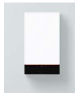
Vitodens 100-W (B1HF și B1KF)

Vitodens 100-W / 111-W au fost testate și aprobate pentru gaze naturale și GPL în conformitate cu EN 15502.