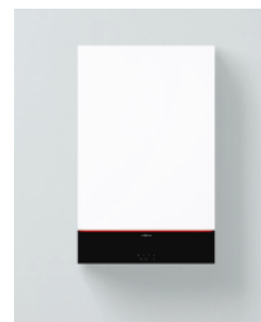
Vitodens 111-W (B1LF)